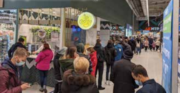
Черга на вакцинацію у Бучі в суботу 30 жовтня в Епіцентрі