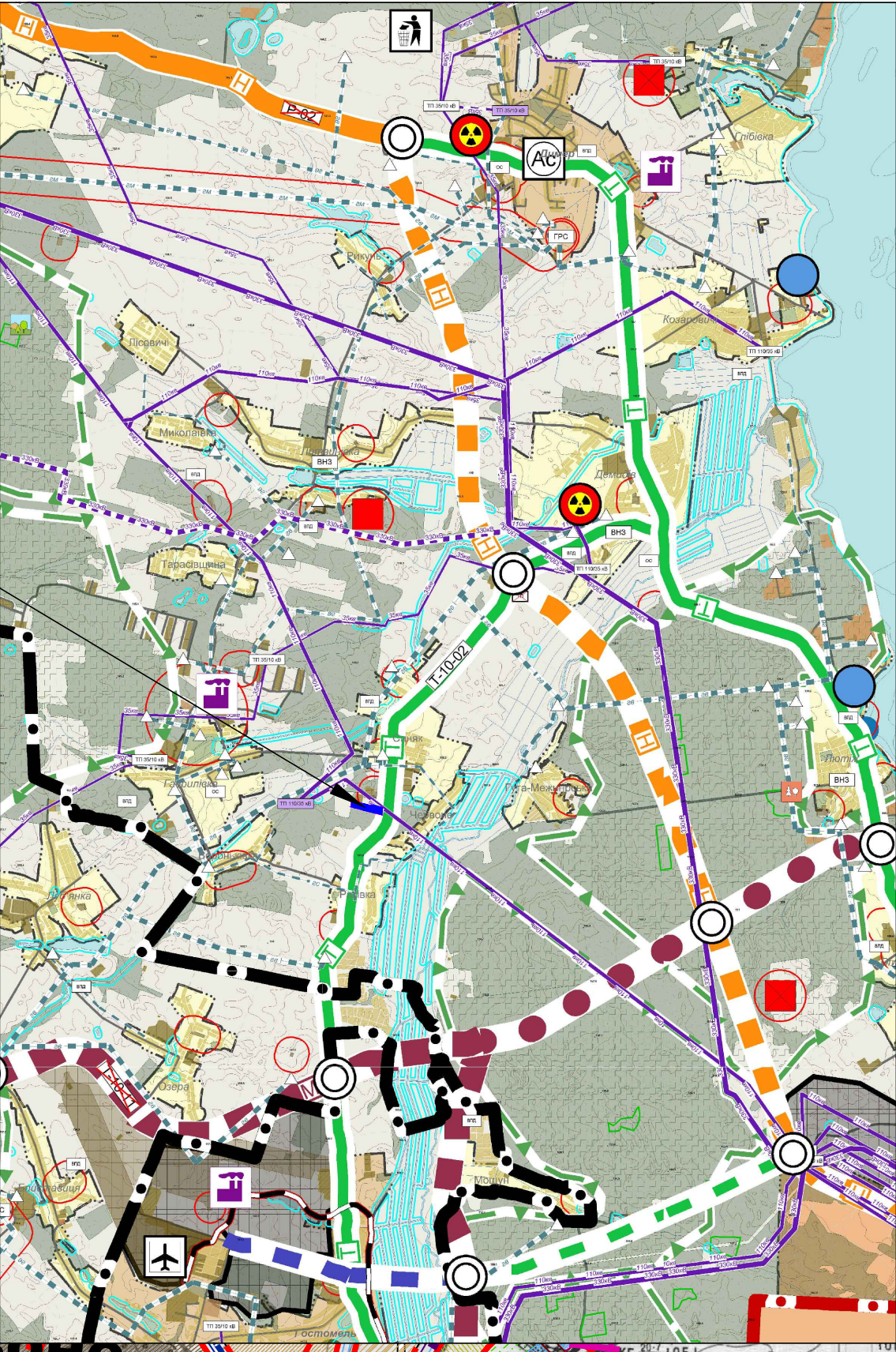
ТЕРИТОРІЯ ЩО РОЗГЛЯДАЄТЬСЯ