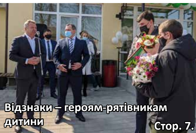
Відзнаки – героям-рятівникам дитини Стор. 7.

Вітаємо всіх, хто входить до складу Національної гвардії, і дякуємо за вірність військовій присязі та відданість українському народові!